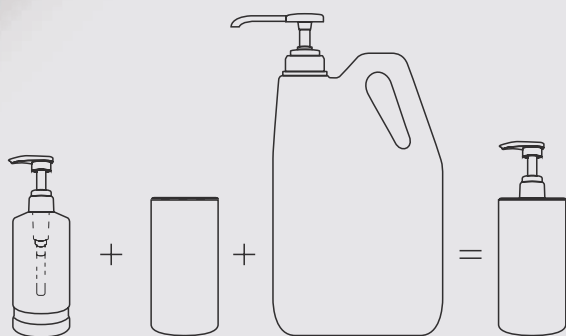
Flacone 480 ml 480 ml Bottle

Allows scheduling of filling, without daily intervention.