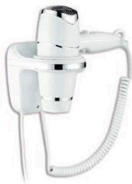
MDL704004 YUL/ASCIUGACAPELLI A MURO BIANCO 1800W *solo su ordinazione