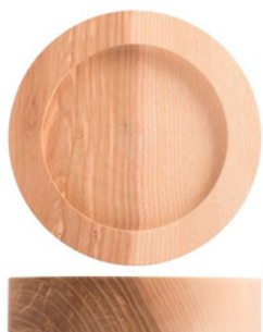
PNGo855100 BASE FRASSINO PER DIFFUS. 1LT