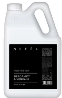
INT723T5 NEFEL/SAPONE MANI BLACK AMBER 5KG (CRT4)