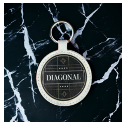
personalizzabile PORTACHIAVI ROTONDO