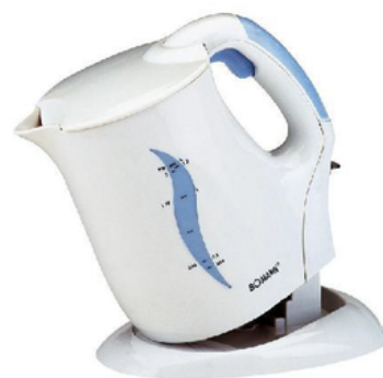
KAU025203 BOLLITORE CB557 BIANCO 1,2L 850W BOMANN