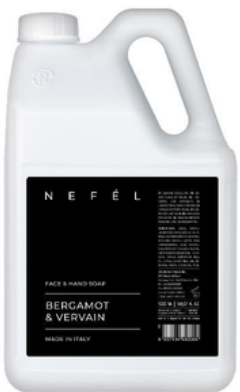
INT724T5 NEFEL/SHAMPOO DOCCIA BERGAMOTTO 5KG (CRT4)