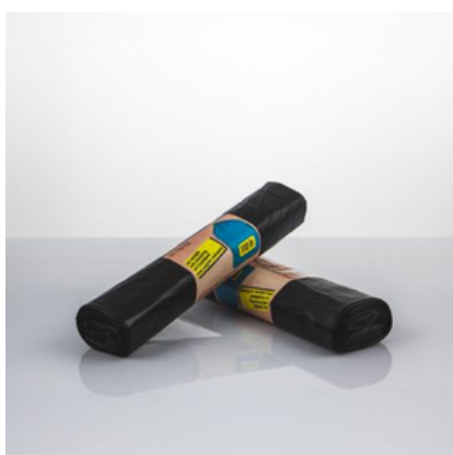
NDPSP077 ROT.25 SACC PATTUME NERO 50X60 HD 6GR (CRT40)