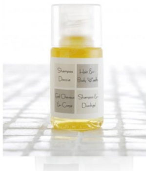
GFLP20MN NEUTRA/FLACONE DOCCIA SHAMPOO 20ML CF50 (CRT8)