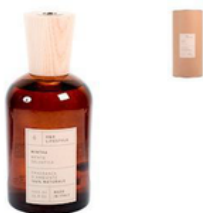
DIFFUS AMBIENTE 1LT (CRT4) varie fragranze: