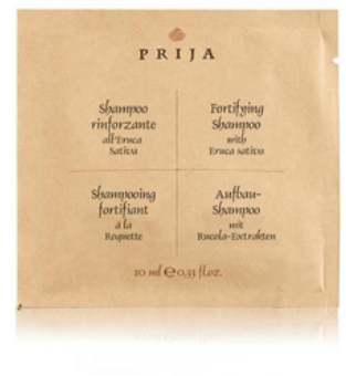
GFLAB32SPR PRIJA/BUSTINA SHAMPOO ALL'ERUCA SATIVA 10ML CF500