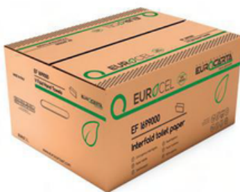
CAEEF1699000E CARTA IGIENICA INTERFOGLIATA CF225 (CRT40)