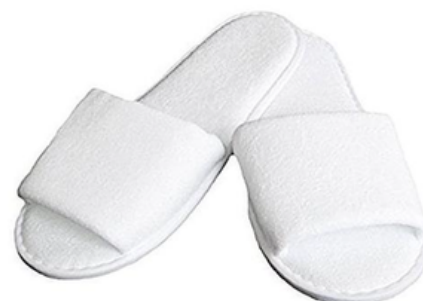
LEOW4707 CIABATTA SPUGNA APERTA CF50 PAIA