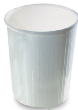
GIG1950M3/GR CESTINO GETTACARTE TONDO GRIGIO 30 LT