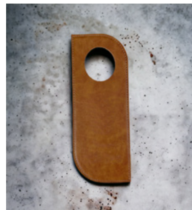
personalizzabile NON DISTURBARE MOSSO