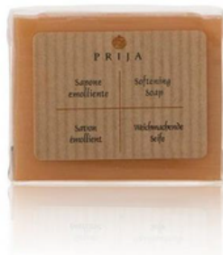
GFLB1625PR PRIJA/SAPONE VEGETALE INCARTATO 25GR CF336