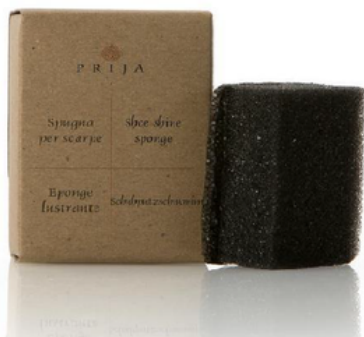
GFLF021PR PRIJA/SPUGNA PULIZIA SCARPA CF100 (CRT10)