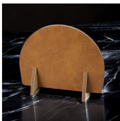
personalizzabile SEGNAPOSTO ROTONDO