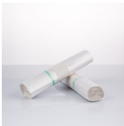
NDPSP154 ROT.30 SACC PATTUME NEUTRO 35X45 HD 3GR (CRT50)