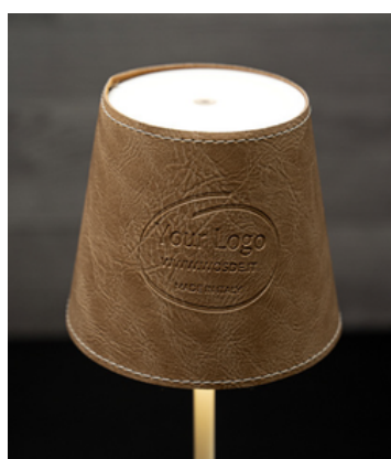
personalizzabile COVER LAMPADA