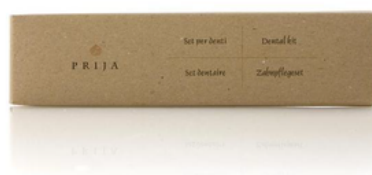
GFLE081PR PRIJA/SET DENTI ASTUCCIATO CF100 (CRT5)