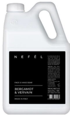
INT721T5 NEFEL/SAPONE MANI BERGAMOTTO 5KG (CRT4)