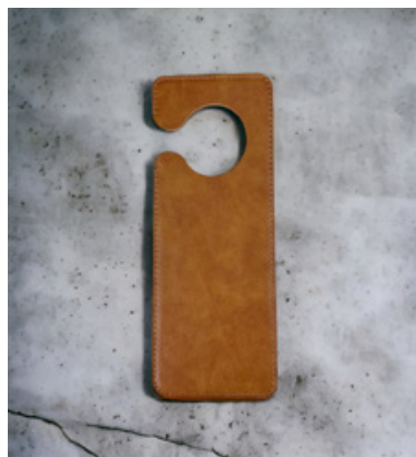
personalizzabile NON DISTURBARE PAPPAGALLO