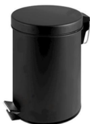
PNG8740205 PATTUMIERA C/PEDALE NERO 5LT