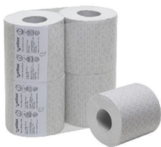
CEL10100CX CARTA IGIENICA FASCETTATA CF4(CRT10)