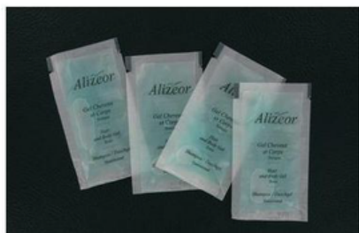
ECF269357 GEL SHAMPOO DOCCIA CF500