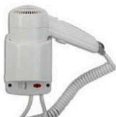
MDL704002 YUL/ASCIUGACAPELLI A MURO BIANCO 1200W *solo su ordinazione