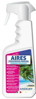
INT527F7 AIRES FRESCHEZZA MARINA 0,75 (CRT6)