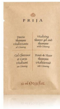
GFLAB01PR PRIJA/BUSTINA DOCCIA SHAMPOO GINSENG 10ML CF600