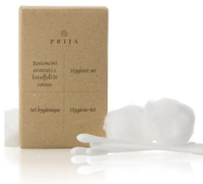
GFLD051PR PRIJA/SET 4 COTTON FIOC E 3 BATUFFOLI COTONE CF100 (CRT10)