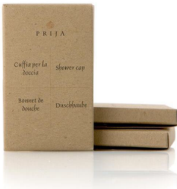
GFLC021PR PRIJA/CUFFIA DOCCIA CF100 (CRT10)