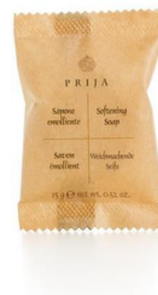
GFLB09PR PRIJA/SAPONETTA ROTONDA FLOW P.15GR CF300