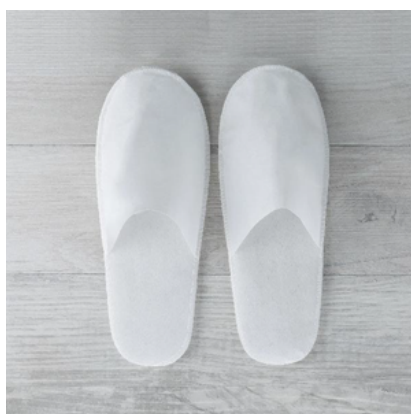
GFLF013_EBK LOGO/CIABATTA CHIUSA TNT ECO CF250