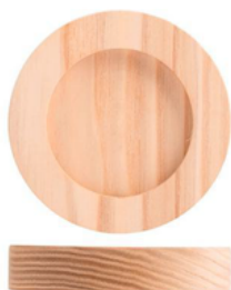
PNGo855200 BASE FRASSINO PER DIFFUS. 250ML