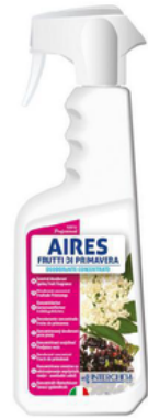
INT528F7 AIRES FRUTTI DI PRIMAVERA 0,75 (CRT6)