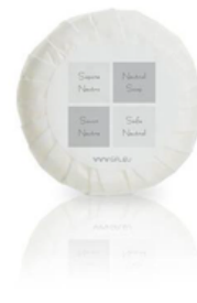
GFLB02N NEUTRA/SAPONE VEGETALE 20GR TONDO PLISSE' CF280