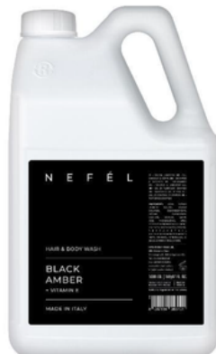
INT726T5 NEFEL/SHAMPOO DOCCIA BLACK AMBER 5KG (CRT4)