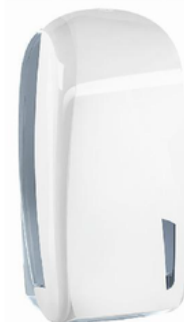
MAPA90901 SKIN/C.I.INTERFOGLIATA BIANCO ?E