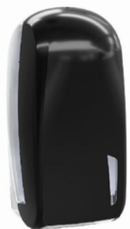
MAPA90913BM SKIN/C.I.INTERFOGLIATA CARBON ?E