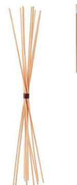
PNGo855000 SET 10 BASTONCINI DIFFUS AMBIENTE 50CM