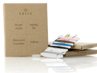
GFLC071PR PRIJA/SET MINICUCITO CF100 (CRT10)