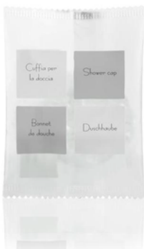
GFLC01F NEUTRA/CUFFIA DOCCIA FLOW P. CF100 (CRT10)