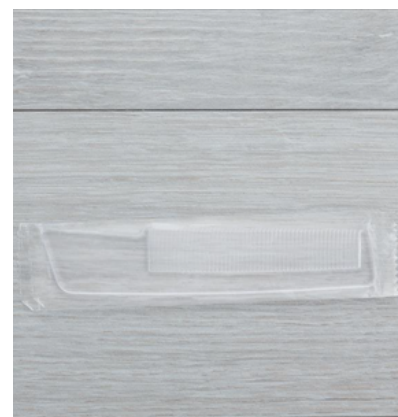
GFLC055_BK LOGO/PETTINE TRASP.MANICO CF100(CTR10)