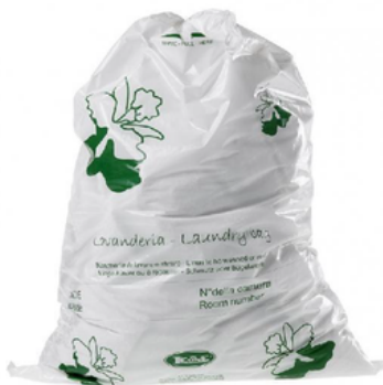
LEOW5001 SACCHETTO LAVANDERIA 39X54 CF100(CRT10) ?E