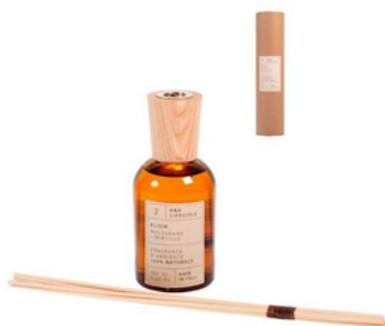
DIFFUS AMBIENTE 250ML (CRT9) varie fragranze: