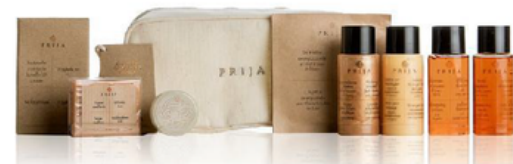
GFLK08PR PRIJA/KIT IN POCSETTE RETT.18X4X9 COTONE