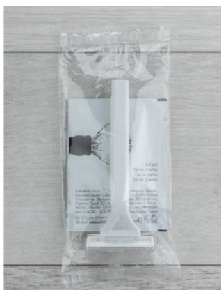
GFLF010_BK LOGO/SET BARBA CF100 (CRT6)