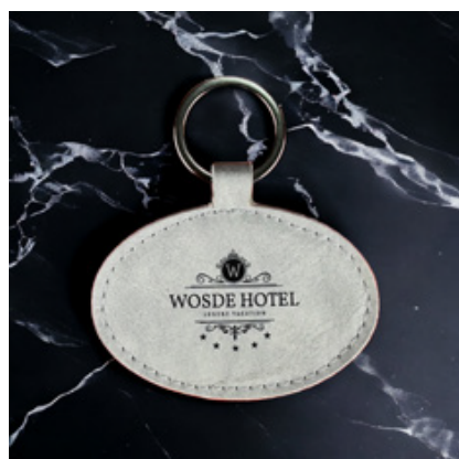
personalizzabile PORTACHIAVI OVALE