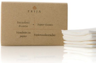
GFLH081PR PRIJA/5 FAZZOLETTI CARTA SCATOLA CF100(CRT3)