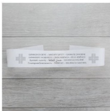
GFLG09N LOGO/SIGILLO WC GARANZIA CF2000