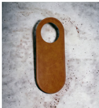
personalizzabile NON DISTURBARE ROTONDO