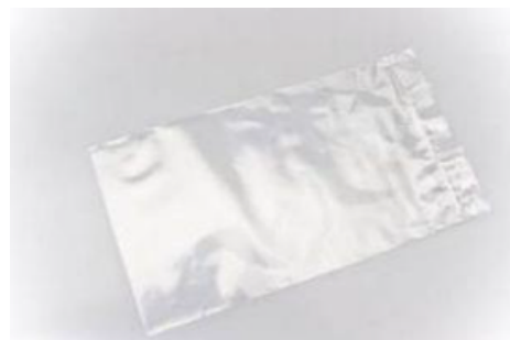
GND0254 SACCHETTO POLITENE USO ALIM. SP4 60X80 KG10