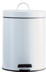
MDL112051 PAP/PATTUMIERA 5LT BIANCO