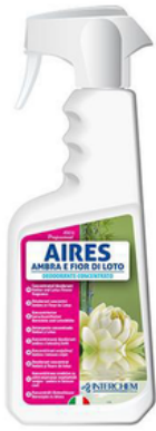
INT524F7 AIRES AMBRA E FIOR DI LOTO 0,75 (CRT6)