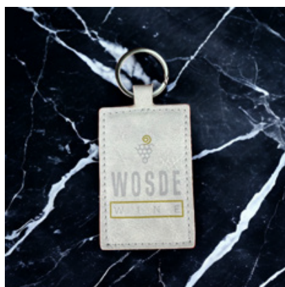
personalizzabile PORTACHIAVI RETTANGOLARE